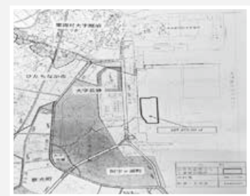
常陸那珂港区埋立地