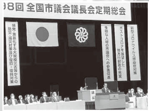
全国市議会議長会