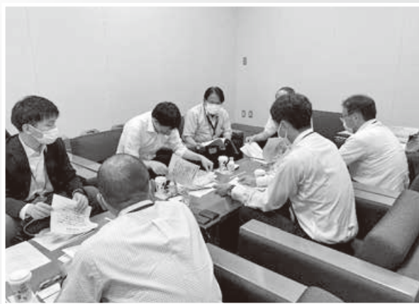
会派研修会（国税庁 官僚レクチャー）