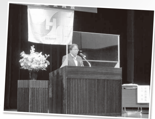
社会を明るくする運動講演会