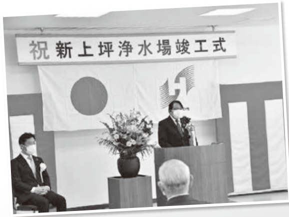
上坪浄水場竣工式