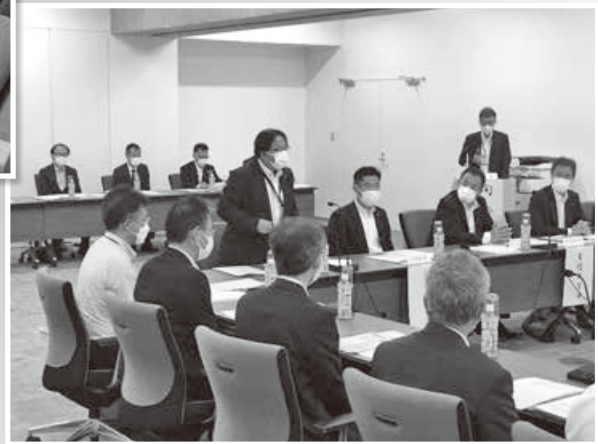
那珂川改修期成同盟会総会