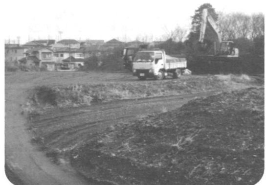
六ツ野スポーツの杜公園整備事業