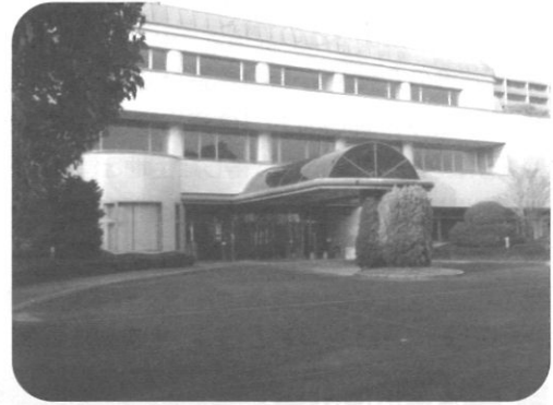
子育て支援・多世代交流施設 (旧サイエンスラボ)