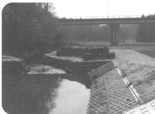
河川改修工事中の大川