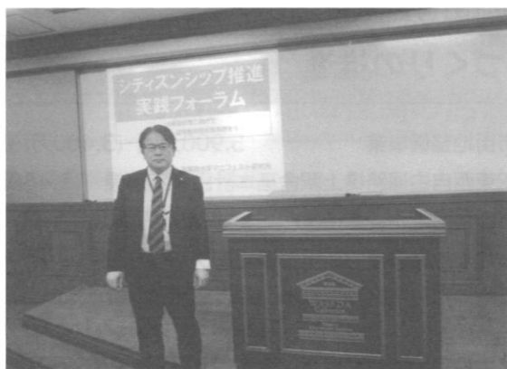
マニフェスト研究所のフォーラム(早稲田大学)