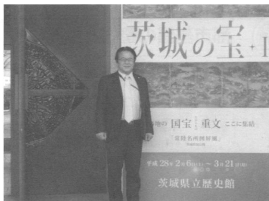
観光振興のため本市関連展示物を視察(歴史館)