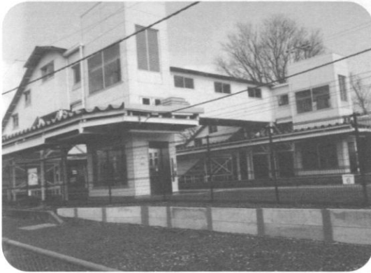
橋上化計画中の佐和駅