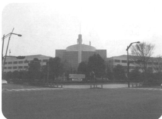
産業活性化支援事業