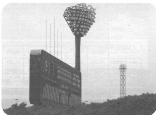
改修予定のスコアボード (総合運動公園)