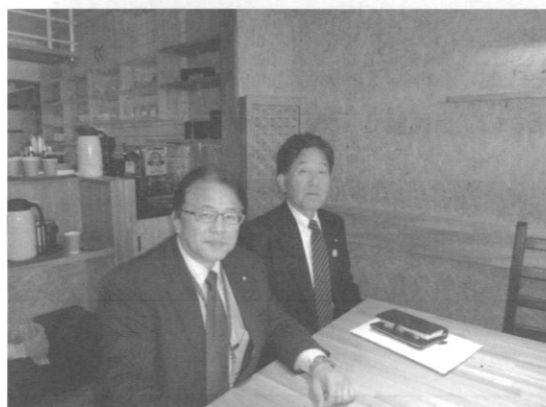
にこにこプラザオープン(鈴木商工会議所会頭と)