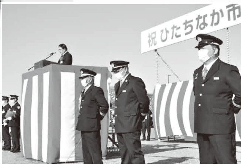
ひたちなか市消防出初式