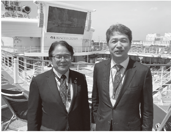
クルーズ船寄港歓迎セレモニーで大井川知事と