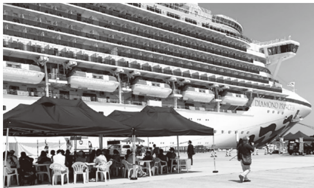
入港したダイヤモンド・プリンセス号