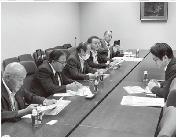
行政調査(農水省大臣官房)