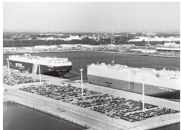
RORO 船