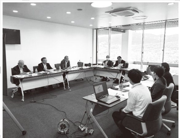
行政調査(群馬県沼田市)