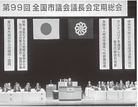
全国市議会議長会総会