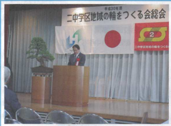
コミュニティ総会