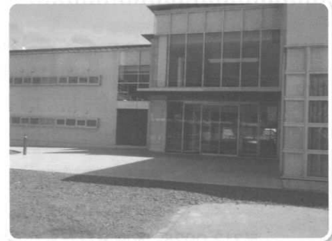
那珂湊支所新庁舎