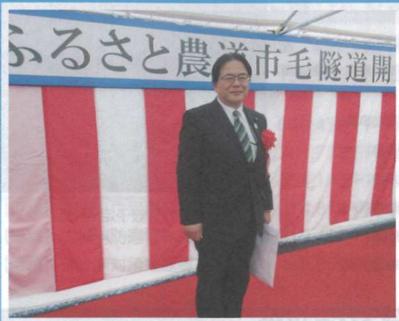
ふるさと農道市毛隧道開通式