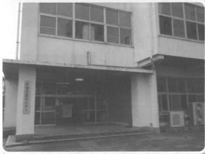
旧生涯学習センター