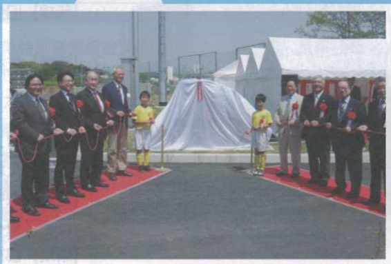
六ツ野スポーツの杜公園開園除幕式