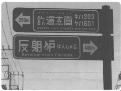
観光周遊案内看板