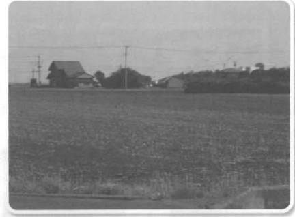
統合校建設予定地付近