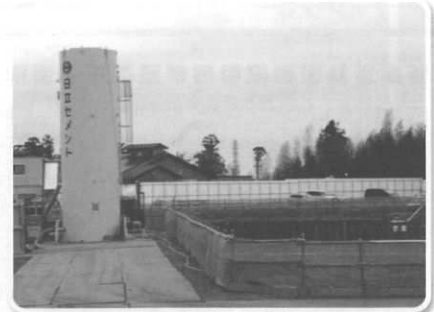
建設中の上坪浄水場